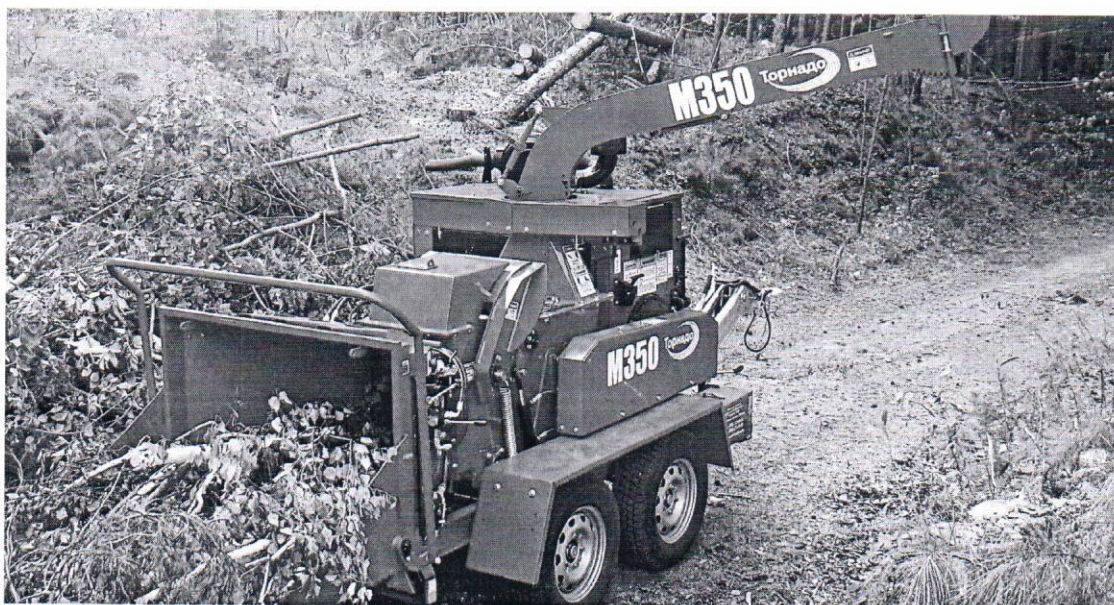
Технические характеристики Торнадо М350

ПРИЦЕПНОЙ ИЗМЕЛЬЧИТЕЛЬ ТОРНАДО М350 (ПРОИЗВОДСТВО РОССИЯ)