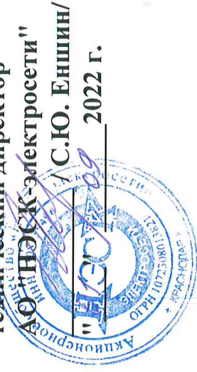
График временного отключения потребления (ГВО)