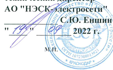
График ограничения режима потребления электрической мощности (ГОэм) на 2022/2023 гг.

по филиалу АО "НЭСК-электросети" "Крымскэлектросеть"