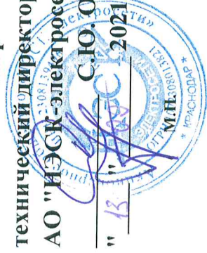
График ограничения режима потребления электрической мощности (ГОэм) на 2021/2022 гг.